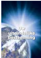
Uw uiteindelijke bestemming

De volgende boekjes kunnen u helpen een beter begrip te krijgen van Gods plannen voor u en de wereld.