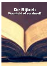
De Bijbel: waarheid of verzinzel