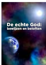
De echte God: bewijzen en beloften

U kunt alle literatuur online bestellen via WereldvanMorgen.nl