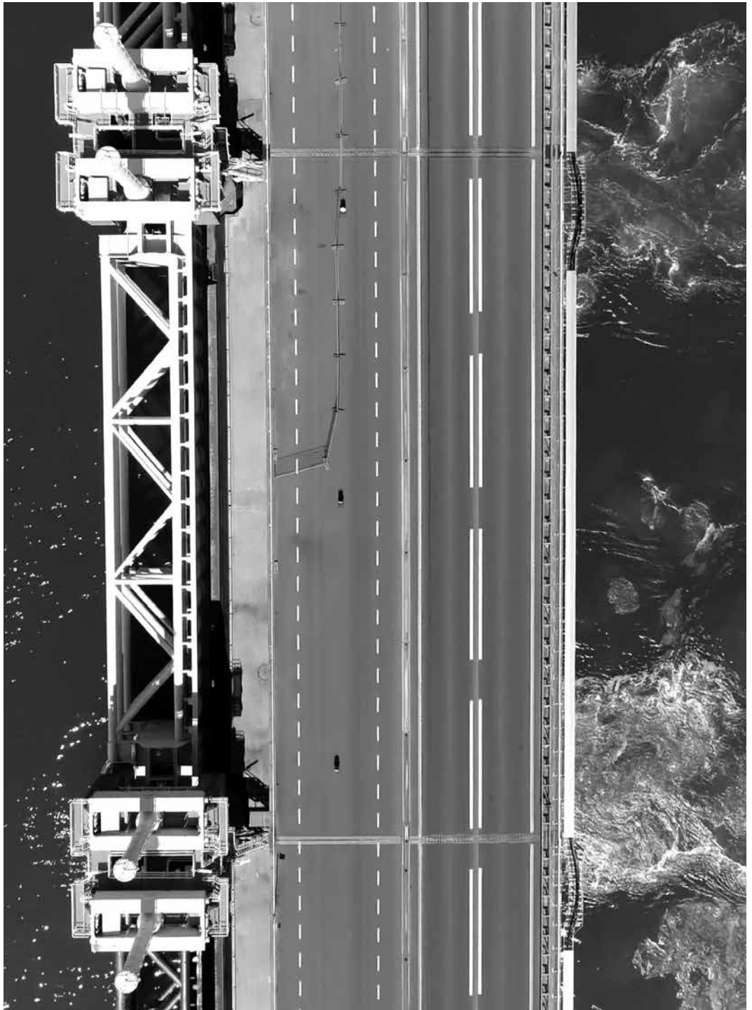
Stormvloedkering genaamd de Oosterscheldekering